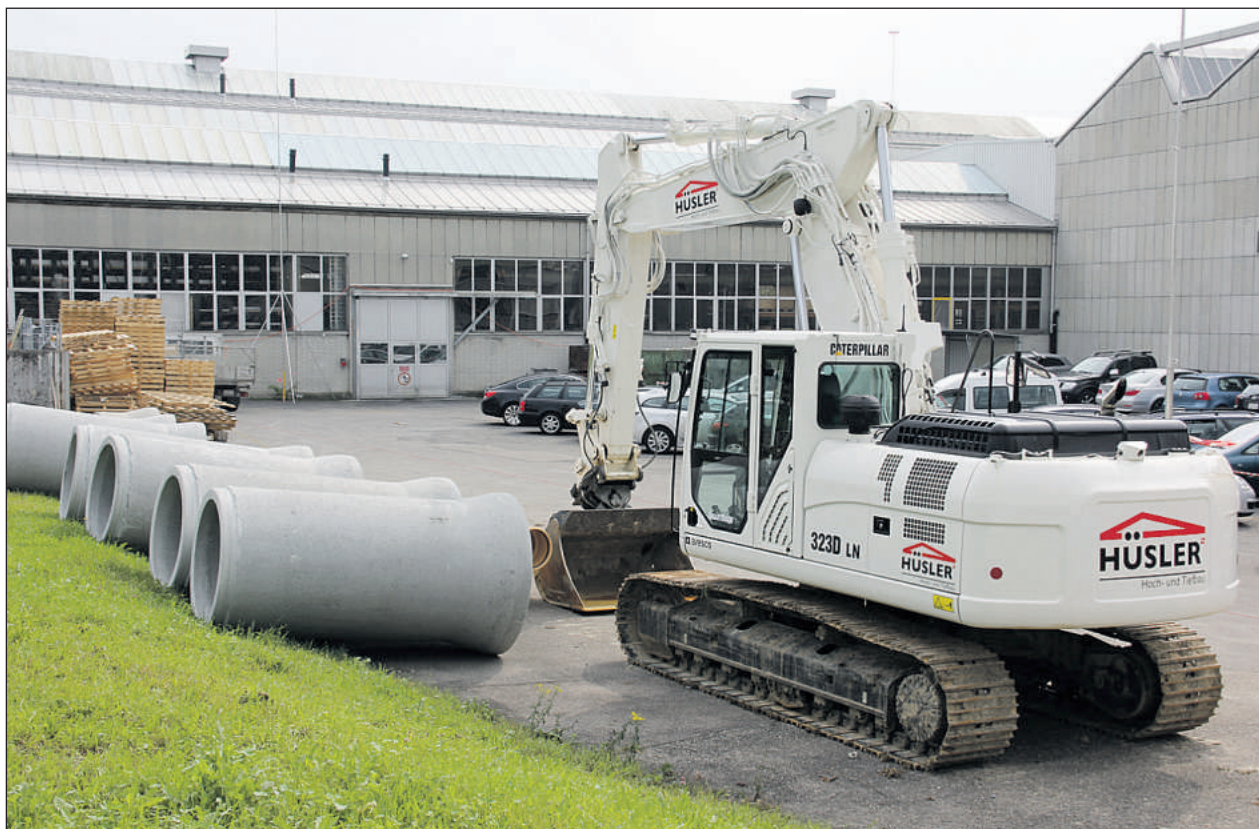
Die Firma Metall Service AG Menziken auf Expansionskurs: Am bisherigen Standort laufen die Vorbereitungen für eine Betriebsenerweiterung, zu der auch der Bau einer Umfahrungsstrasse gehört.

Durch die neue Lager- und Logistikfläche kann das Materialhandling in Zukunft komplett «in house» abgewickelt werden.